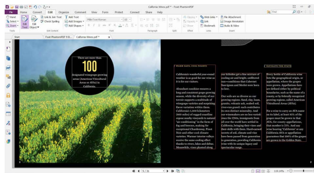
Possibilité de modifier le contenu et la mise en page comme avec un traitement de texte